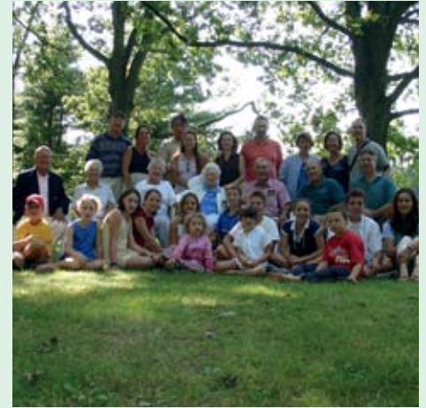
Awon eje ayewo alagbase CEPH wa lati odo awon idile ti o ni awon agbagba ati omode ni ilu Utah ni ori le ede Amerika, ati ti opolopo ninu irandiran won wa lati ila orun ati guusu ni ori le ede Yuroopu.

Won ko da egbe amoye agbegbe CAG kan kan pato fun awon ti o fi eje ayewo sile fun alagbase CEPH, sugbon pupo ninu awon ti o fi eje ayewo sile ni won si nran awon awadi lowo ti o gba awon eje ayewo lowo won pelu ise won titi di ojo oni Aseyori awon ifowosowopo ojotipe won yi ati iwulo awon eje ayewo CEPH fun ise iwadi ati fun ilo titi di ojo oni o je gege bi ohun ti a lero lati se pelu ise agbase HapMap bi a ba ti ngba awon eje ayewo lati awon agbegbe omiran.